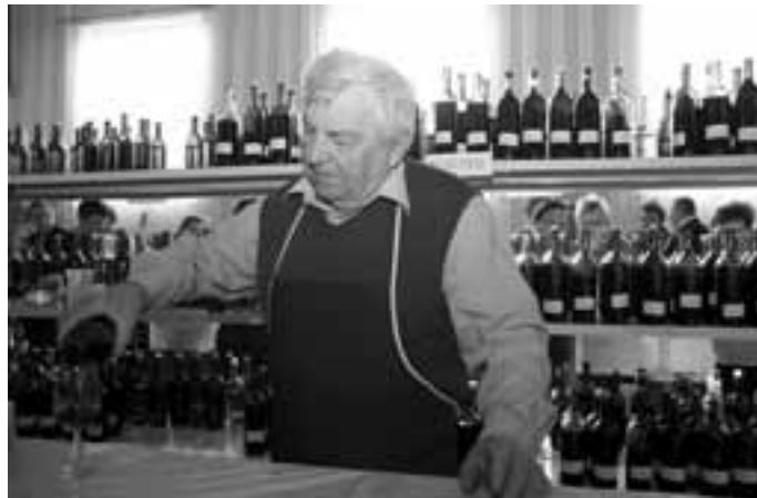
Blatnický košť vína patří mezi hodně vyhledávané akce.