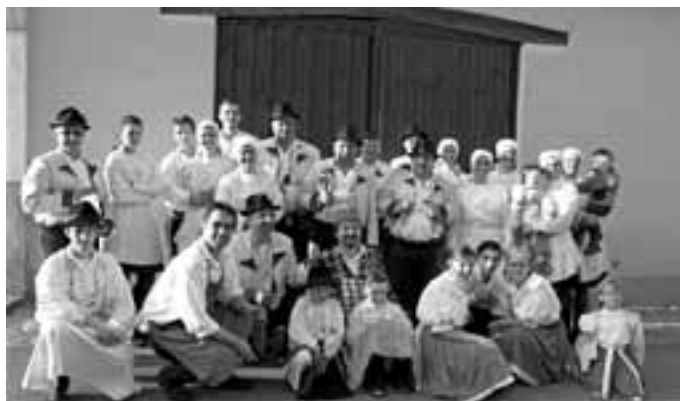
Folkloristé v Ostrožské Lhotě mají už boj o evropské peníze za sebou. Ve spolupráci s Mikroregionem Ostrožsko a obcí opravili starý domek, který využívají k udržování lidových tradic.