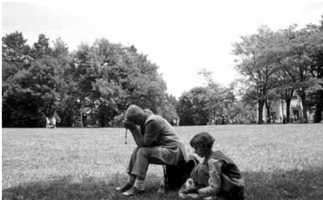
Bud' vítán člověče. Ať jsou tvé modlitby vyslyšeny...