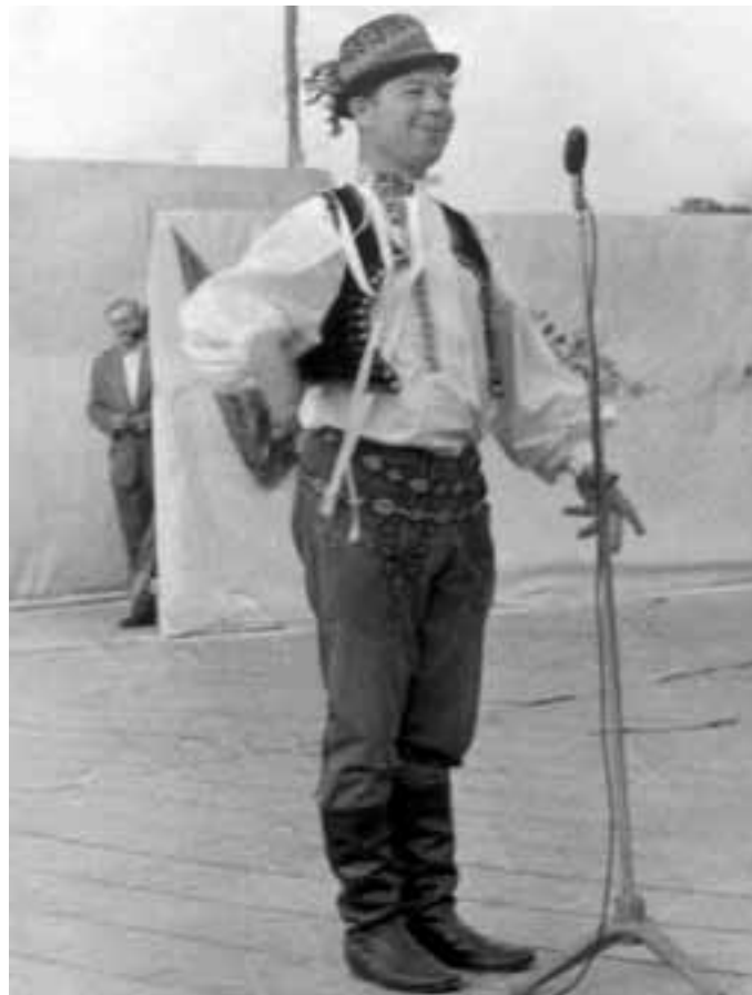
Legendární vypravěč Vašek Mlýnek v Hluku v roce 1959.