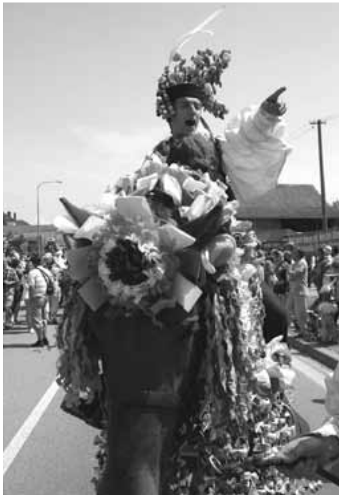
Vlčnovský vyvolávač 2007

Potkával jsem členy královské družiny, které jízda králů bavila, bylo také vidět, že ve Vlčnově se daří folklóru, nechyběl místní dětský soubor ani mužský sbor. Dal jsem se také do řeči