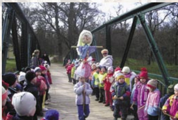
Vynášení Moreny ve Veselí nad Moravou