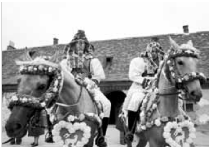
Jízda králů, Kunovice 2004