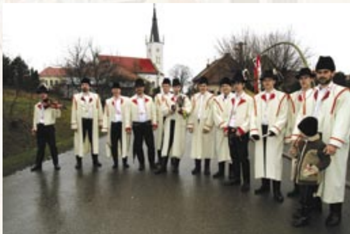
Velikonoce v Ostrožské Lhotě