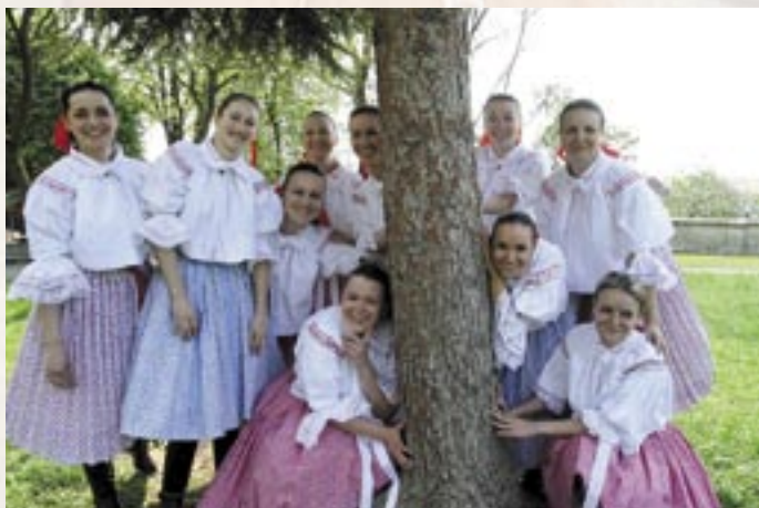
Ženský sbor Klebetnice z Hluku