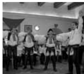
Po představení králů i družiny se už rozjela zábava, nechyběli ani verbíři.