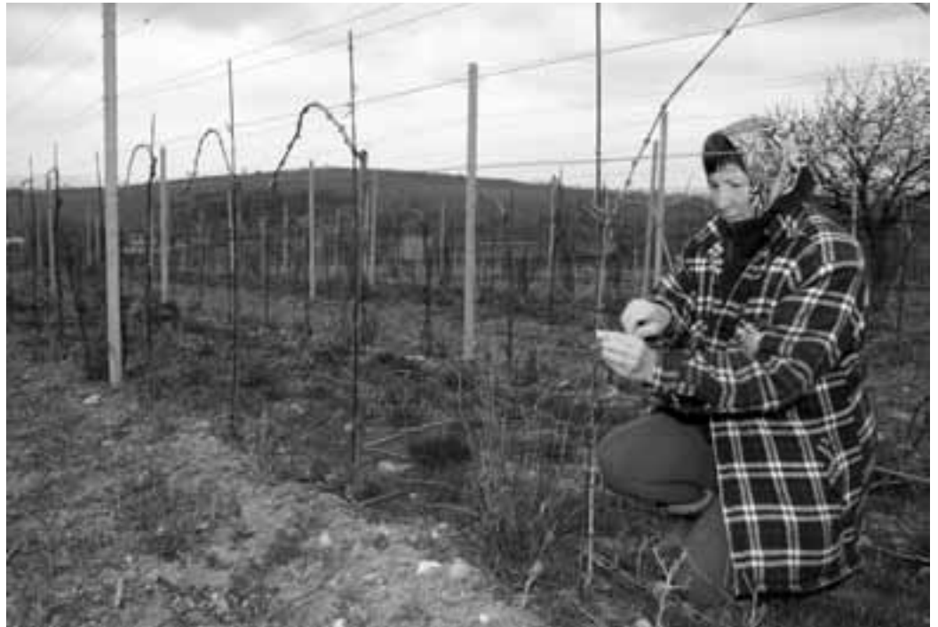
Jarní práce na Slovácku.