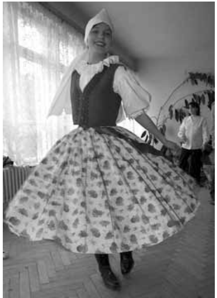
Tak vypadá střílečský ženský kroj, který se podařilo místním folkloristům obnovit.