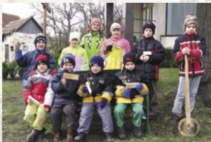
Klepání v Malé Vrbce