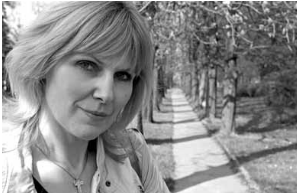
„Někdy si říkám, že jsem dostala na něco nadání, talent, ale nemůžu mít štěstí ve všem.“