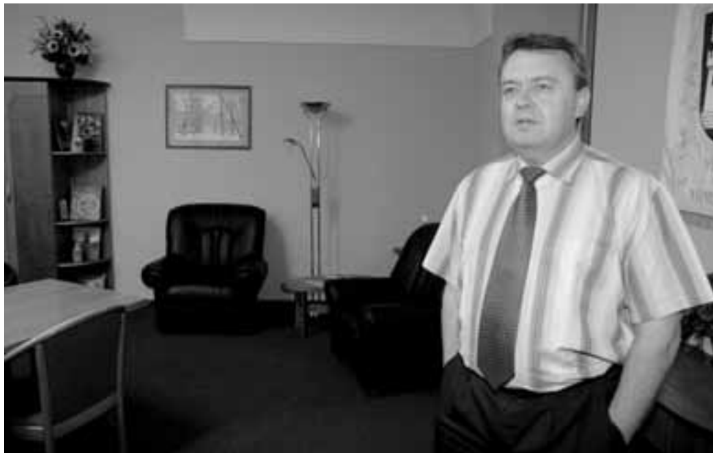
„Ti dva hoši zjistili, že daleko snazší život je s komunisty a socialisty,“ říká exstarosta na adresu svých dvou dřívějších spojenců, kteří ho nakonec „dostali“ z radnice.

Pan doktor pro mě určitě žádnou přítěží nebyl. On je člověk, který, když něco dělá, tak to dělá pořádně a důsledně. Je ohromně vzdělaný a pracovitý, na radnici odvedl opravdu ohromný kus práce, a podle mě ti dva hoši zjistili, že daleko snazší život je s komunisty a socialisty, kde si