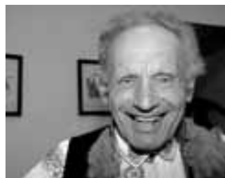
A toto je už druhý nejstarší žijící král - pan Rybníkář, který dokáže zajímavě vyprávět.