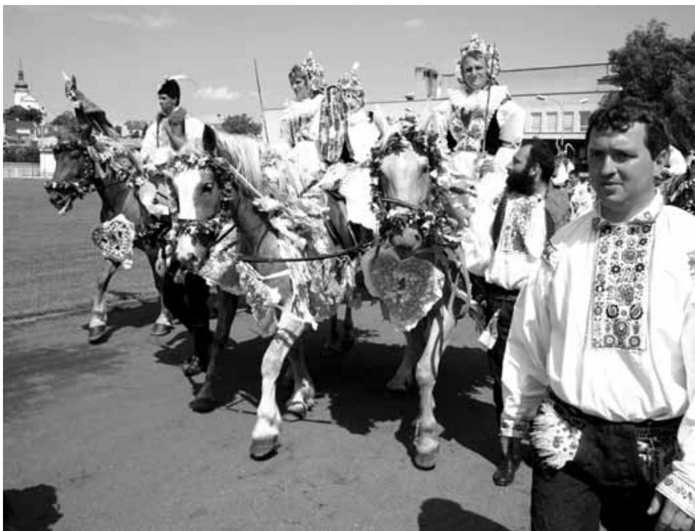
Jízda králů v Hluku 2005. Místní kluci ji jezdí už stovky let. Jen její podoba se mění - tak jako se měníme my sami.

Hlukem, Kunovicemi a Vlčnovem projede královská družina