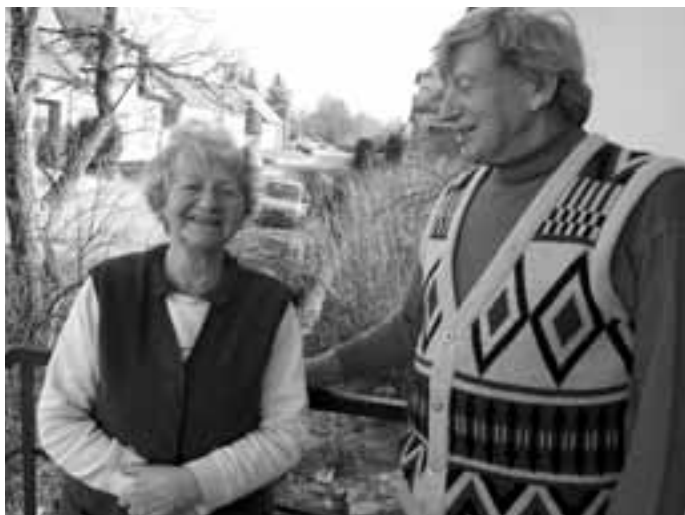
Se svou manželkou letos na jaře.