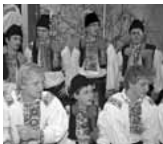
Všichni kluci přišli na večer v kroji. Účast ani kroj přitom nebyly povinné.