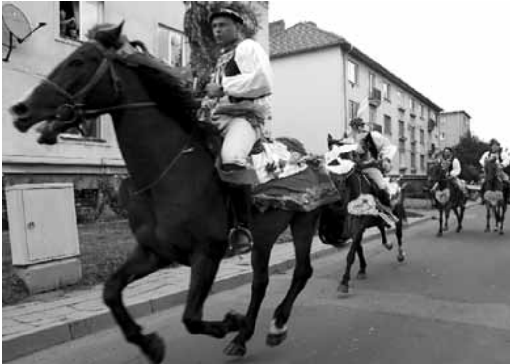
Jízda králů ze Skoronice na Slováckém roku v Kyjově 2007. Všimněte si koní i jezdců.