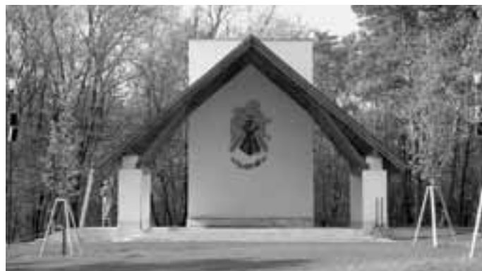
Poslední práce na novém polním oltáři.

stínu chátrajících zdí odpočívá dobytek. Největší pokoření tohoto místa,“ můžeme si přečíst na tabuli kousek od vchodu do kaple. Pokoření trvalo třicet let.