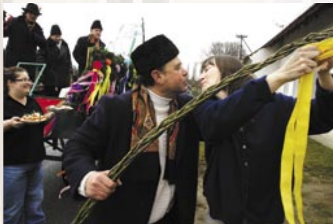
Velikonoce v Uherském Ostrohu