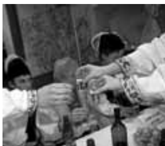
Samozřejmě nechyběl přípitek. Tento byl první a určitě ne poslední.