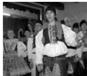
Večer bylo představeno také téměř třicet členů družiny. Zájem o jízdu je velký.