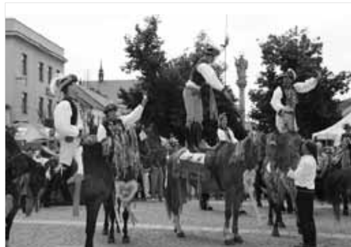
Odvaha jezdců před kyjovskou radnicí.