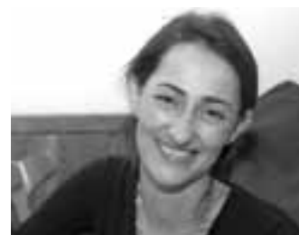
A další dáma. Tato seděla mezi diváky. Určitě by jí to slušelo také při tanci.