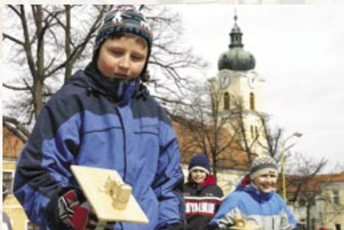
Klepání v Blatnici pod Sv. Antonínkem