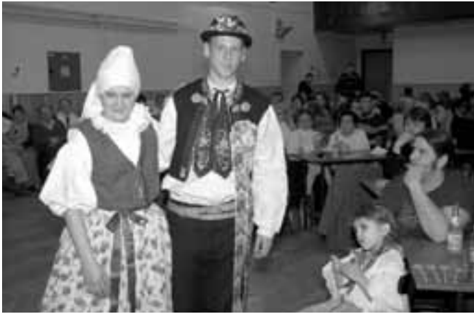
Místní kulturák byl plný lidí, mnohé skutečně zajímalo, jak vypadal kroj, v němž chodili jejich předci.

Čím více jezdím po Slovácku, tím více žasnu nad jeho pestrostí. Podívejte se tentokrát na „hranice“ Slovácka.