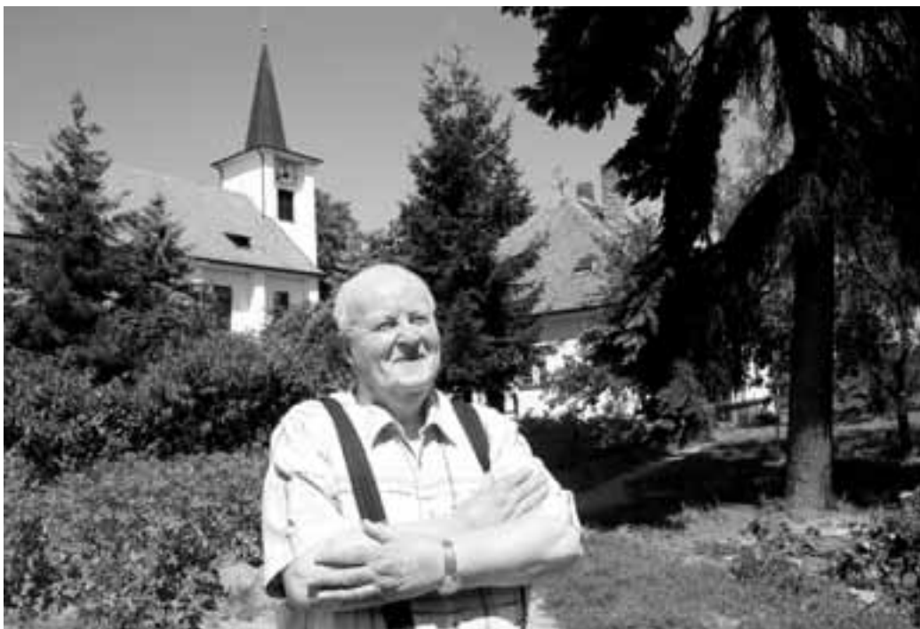
Když slavil 80 let, přišla mu přát celá vesnice.