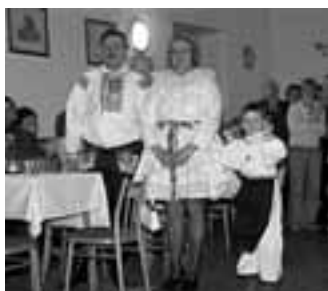
Rodiče krále Lukáše s nejmladším synem. Pro úspěch jízdy králů dělají maximum.