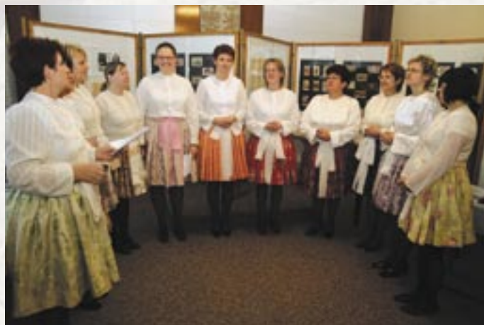
Ženský sbor z Ostrožské Nové Vsi