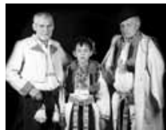
Všichni tři králové na „oficiálním“ snímku fotografa Martina Sekaniny.