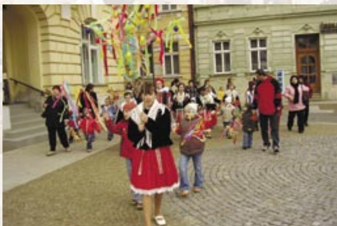
Vítání jara v Uherském Ostrohu