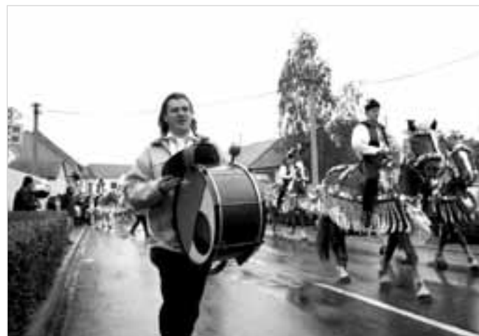
I když pršelo, vyjela kunovská královská družina do ulic.